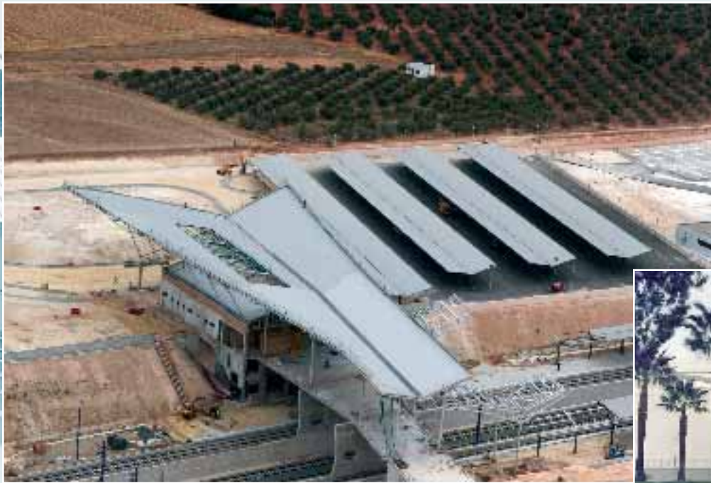
Estación del Ave en Puente Genil, Córdoba.

La treintena de profesionales que forman la plantilla de Parking at the Airport y Airport Parking son el secreto del éxito de esta empresa