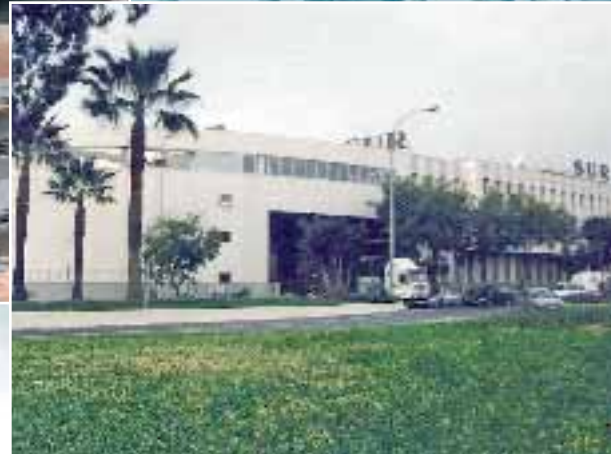
Ampliación de las instalaciones de Diario SUR, Málaga.